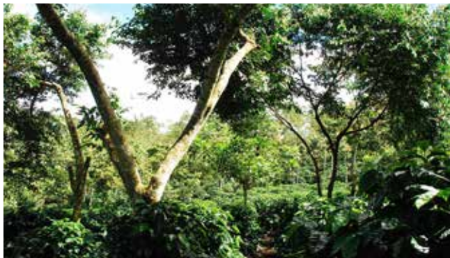
Skuggträd i kaffeedlingar, så kallat agroforestry, är ett sätt att öka en odlings motståndskraft mot ett förändrat klimat.